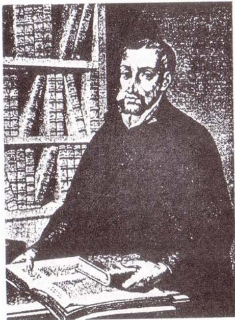
Juan Ginés de Sepúlveda (1490-1573)

In hac controversia Sepúlveda gravem cladem accepit, et libri eius prohibiti sunt. Tamen in theoria quidem 'conquista' percussa est, re vera autem non multa mutata sunt.