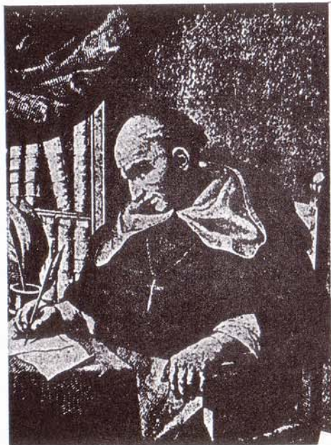
Bartolomé de Las Casas (1474-1566)

'Der altsprachliche Unterricht Jg. XXVII, Heft 6 (1984)