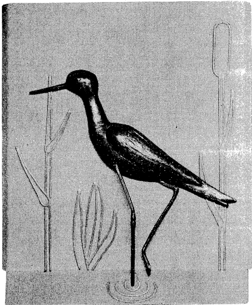
Manibus fidi in aedibus Iosephi Bachmanni, Klosterfeld 25 CH-5630 MURI