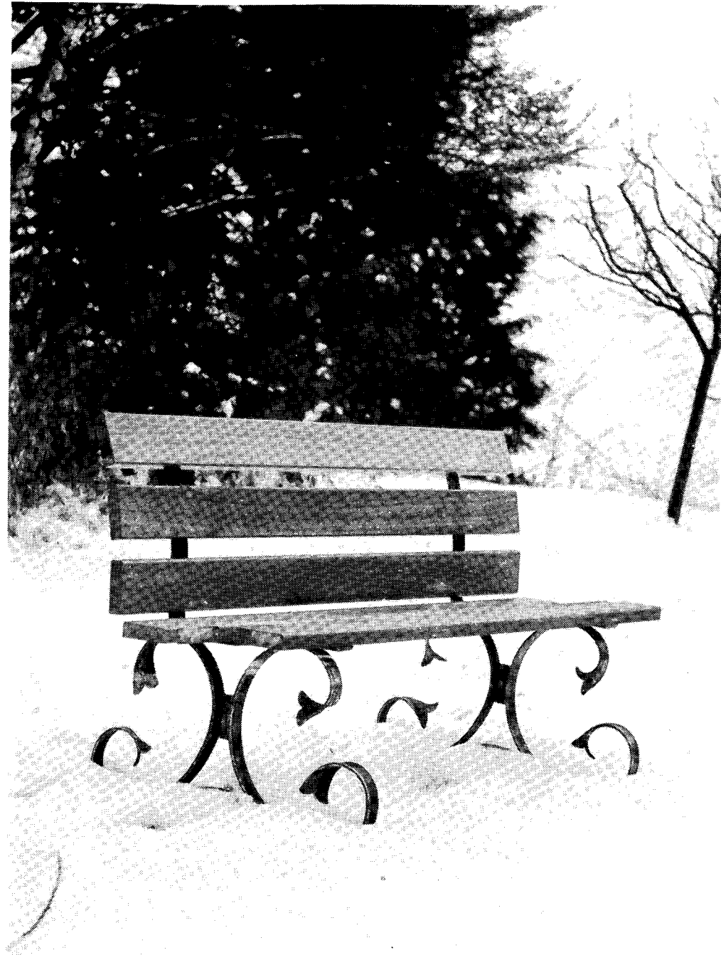
SELLA IN AEDIBVS IOSEPHI BACHMANNI FABRICATA

Magister: Bene! quot sunt triginta et triginta?