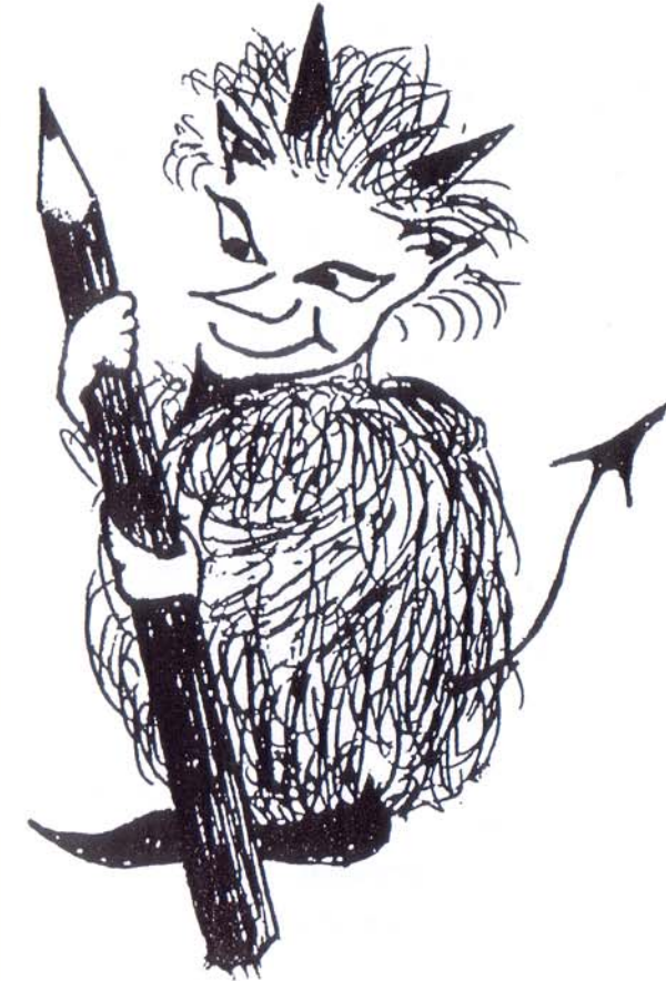
Hunc diabolum typographicum pinxit Simone Aeschlimann

Novistisne illum furciferum, quem a sinistra parte huius paginae videtis? Formido omnium, qui libros, acta diurna vel alia scripta cuiuscumque modi scribunt et edunt, est: Diabolus typographicus! Irridens nos ludibrio habet et clam in scripta nostra subrepat. Singulas litteras vel tota verba mutans vel supprimens ea, quae scripsimus et dicere voluimus, depravat, nonnumquam etiam in contrarium convertit. Cottidie exempla in actis diurnis animadvertere possumus.