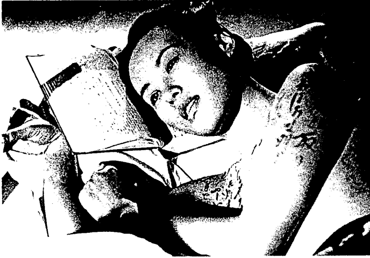
Nagiko et 'Libellus sub cervi- cali con- ditus'

Hunc virum relinquens Nagiko Honcongum (vulgo: Hong Kong) fugit. Ibi ab amatoribus suis petit, ut cutem eius inscribant. Sed amatorem, qui et bene corpus eius inscribere et cupidinem explere scit, non invenit. Itaque ipsa virorum corpora inscribere incipit.