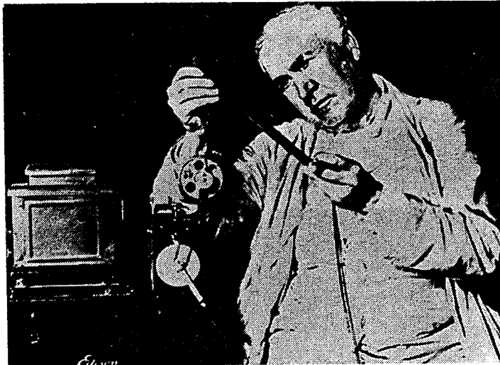
Thomas Alva Edison, taeniolam cinematographi- cam spectans