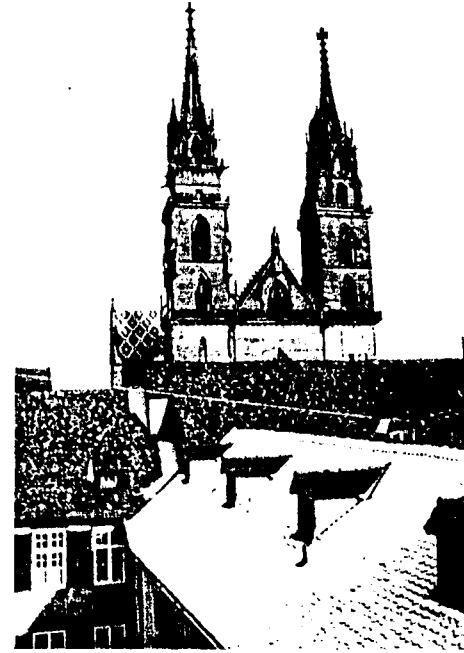
Cum taedium disciplinae subrepat, prospectus in Basilicae Maioris turres discipulos recreat.

quae res miram viris doctis controversiam suscitavit: alteri munimentum illud se invenisse putant, quod secundum Ammi- anum Marcellinum (30,3,1) imperator Valentinianus anno 374 «prope Basiliam» aedificavit (Basiliae sive Basileae nomen hoc loco primum apparet); alteri reliquias istas mediae aetati et saeculo XII assignant, comparando illi castello quod est in oppido Bernensi Thun.