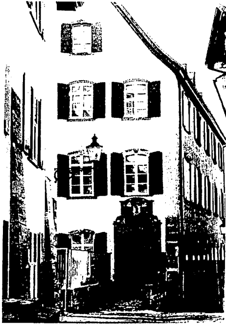
Domus «ad Culicem»: ubi potationes equitum fuerant, conclave ad pontificem maximum eligendum habitum est. Renovatum aedificium Musis patet, initio bibliothecae et picturae, deinde scholarum disciplinae.

S. Clarae templum, anno 1853 civibus catholicae fidei addictis concessum eo loco ubi Clarissarum coenobium fuerat.