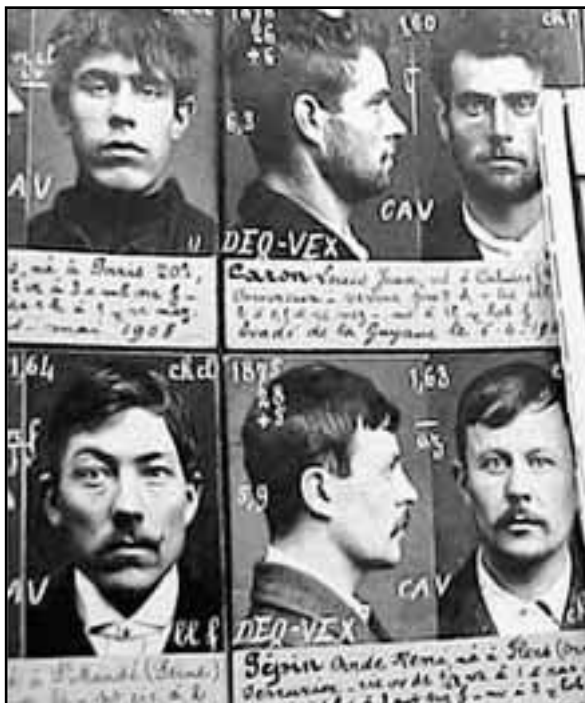
Les scientifiques ont tenté de reconnaître un délinquant à ses seules caractéristiques physiques.

Ces interventions nécessiteraient plus de discernement. Malheureusement, le 11 septembre a provoqué un tel traumatisme aux Etats-Unis que les Américains ont de la peine à agir avec modération. A nous, Européens, de les aider à retrouver leurs points de repères. I