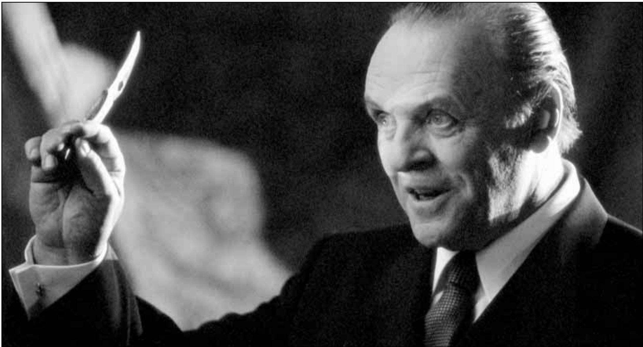
Anthony Hopkins campe le personnage d'Hannibal Lecter au cinéma. Un tueur en série cannibale, extrêmement intelligent, égocentrique, autoritaire, sans remords, sans pitié, manipulateur.