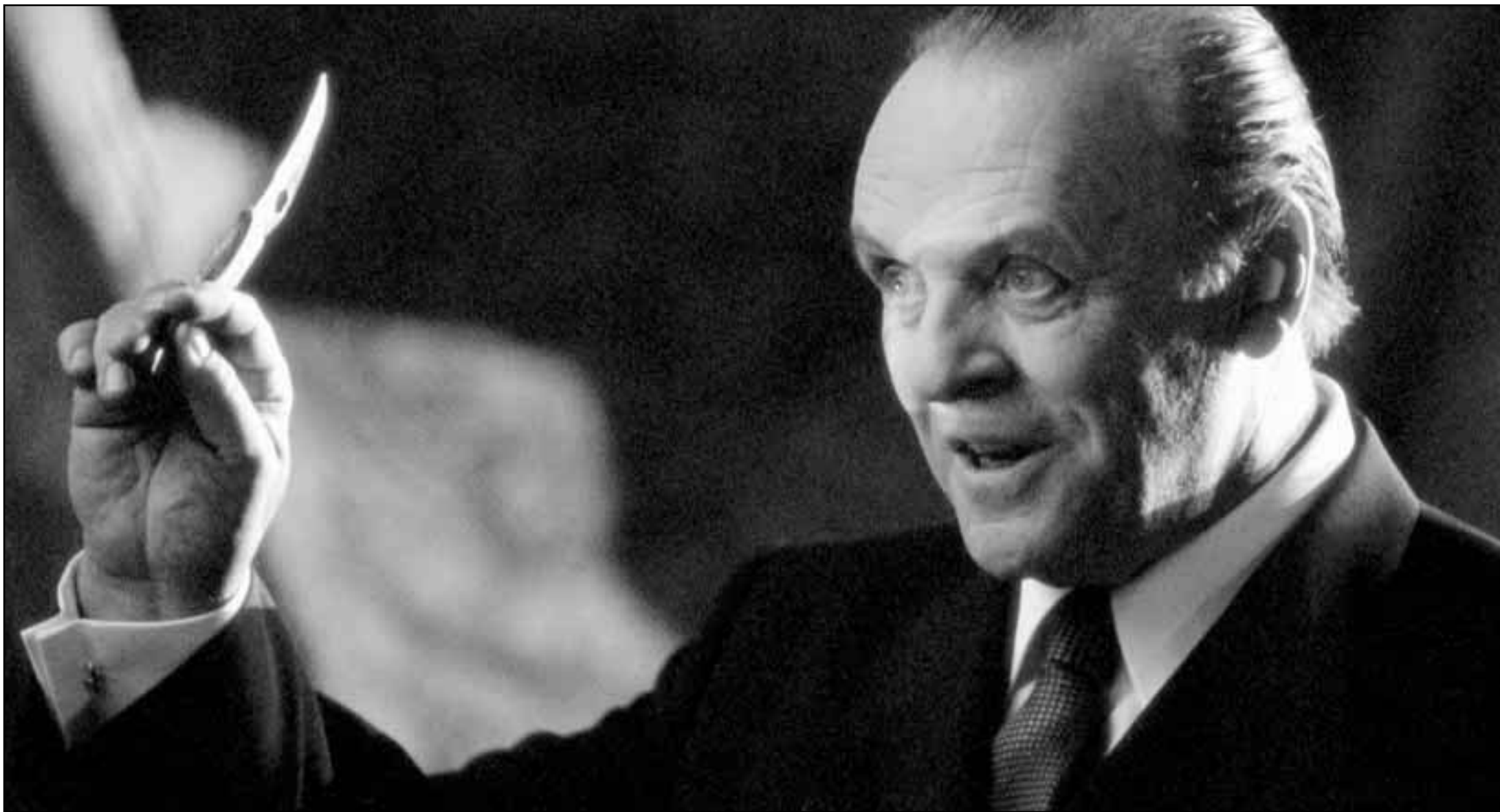
Anthony Hopkins campe le personnage d'Hannibal Lecter au cinéma. Un tueur en série cannibale, extrêmement intelligent, égocentrique, autoritaire, sans remords, sans pitié, manipulateur.